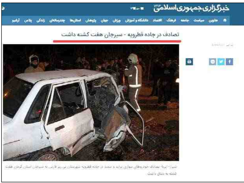
تصادف در جاده قطروبییه - سیرجان هفت کشته داشت

با مرز محیط زیستی استان فارس انطباق نداشتن مرز جغرافی فارس در این باره گفت: حفاظت محیط زیست چهار منطقه دارد، دو منطقه به عنوان پارک ملی و دو منطقه دیگر به عنوان منطقه حفاظت شده، این مناطق حفاظت شده که یکی شکار ممنوع و در حوزه سیرجان به اسم گودغول است و دیگری که از اهمیت بیشتری هم برخوردار است به نام بهرام گور که این منطقه‌ای حفاظت شده بین شهر نیریز و قطروبییه واقع شده است. اهمیت این منطقه به جمعیت قابل توجه گورخر ایرانی ساکن در آن است. مشکلی که در این جا وجود دارد انطباق نداشتن مرز سیاسی جغرافی ما با مرز محیط زیستی استان فارس است و این اختلاف باعث شده که منطقه حفاظت شده بهرام گور که در تقسیمات کشوری در حوزه ماست در مرز محیط زیستی منطقه حفاظت شده استان فارس واقع شود.