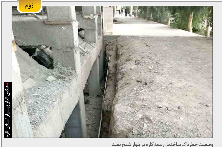
وضعیت خطرناک ساختمان نیمه کاره در بلوار شیخ مفید

یک فعال سیاسی اصلاح طلب، در گفت و گو با اعتمادآنلاین گفت: در حالی ۸ ماه دیگر به انتخابات ریاست جمهوری سال ۱۴۰۰ باقی مانده که به دلایل زیادی این انتخابات نسبت به انتخابات ادوار گذشته ریاست جمهوری از اهمیت به مراتب بیشتری برخوردار است. در واقع انتخابات سیزدهمین دوره ریاست جمهوری در فضایی از راه می رسد که مناسبات ایران با نظام بین الملل حساسیت فوق العاده ای دارد. مثلا در انتخابات سال ۹۶، برجام فضای دیپلماسی کشور را تا حدی به آرامش رسانده بود، اما الان رابطه ای بسیار مستشج با دنیا داریم. به قدری بد که نمی توانیم چنین فضایی را ادامه بدهیم.