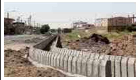
اقدامات انجام شده: خیابان اصلی خرم آباد ادامه هدایت آبهای سطحی مکی آباد