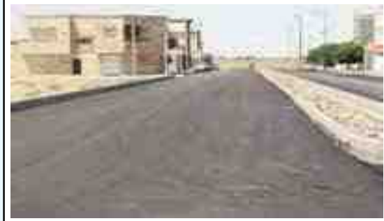
اقدامات انجام شده: تجهیز کارگاه - جدولگذاری بلوار دریا ، میدان صدف ، بلوار ساحل ، بلوار موج - خیابان پشت پمپ بنزین - کوچه ۱۲ متری - تحویل موقت