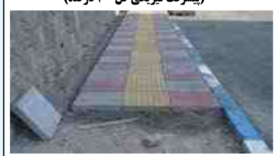
اقدامات انجام شده: روبروی درماتگاه سپیدبالان - روبروی مدرسه امیر کبیر خیابان حکمت مکی آباد - خیابان شفا