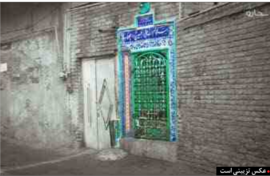
عکس تزیینی است

انحراف و خرافه می‌زنند فقط به خاطر اینکه خودشان اجازه دارند به اعتقاد دیگری با چشم عقل و منطق نگاه کنند اما همان اجازه را دیگران برای نگاه کردن به اعتقاد اینان ندارند! از ترویج این نوع نگاه نصف و نیمه به فرهنگها و آیین‌ها هم چیزی جز خشونت فرقه‌ای در آینده بیرون نخواهد زد. نگاهی به کشورهای دیگر منطقه‌ای خاورمیانه بیندازید. اصلی‌ترین تفاوت محسوس آن‌ها با ایران در بود و نبود امنیت است که ما بیشتر داریم و آن‌ها کمتر. چرا؟ دلیل اصلی‌اش خیلی روشن است زیرا غلبه‌ی همین مدل نگاه منفی به خرده‌فرهنگ‌های جوامع خاورمیانه موجب پدیدار شدن وهابیت، بوکراحم، داعش و طالبان بود.