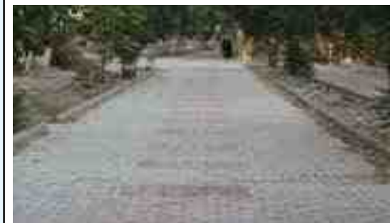
اقدامات انجام شده: اجرای کف پوش بتنی پیاده رو بلوار قائم ۸۰۰۰ متر مربع خیابان صائب ۳۰۰۰ مترمربع - خیابان دهخدا ۳۵۰۰ مترمربع خیابان شهید محمدی جنب مسجد فاطمیه ۲۰۰ متر مربع