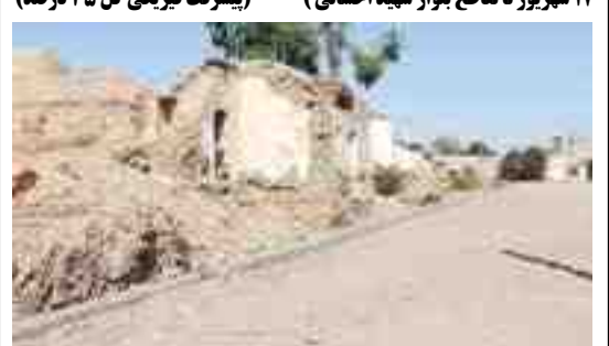
اقدامات انجام شده: جدولگذاری خیابان مابین تخت جمشید و مرودشت آباده بعد از زمین چمن ۱۶۰۰ مترطول