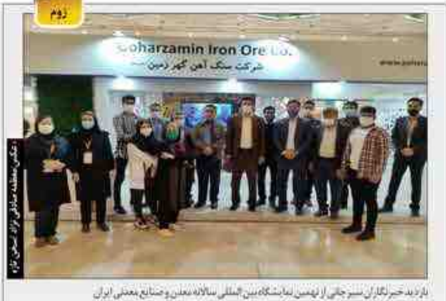
بارزاد خبرنگاران سبز جالی از اینمن نمایشگاه بین‌المللی سالانه معدن و صنایع معدنی ایران