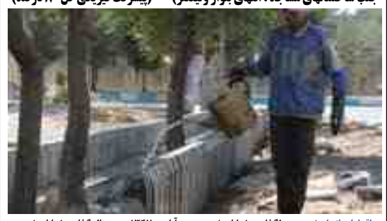
اقدامات انجام شده: جدولگذاری خیابان شهید عزت آبادی ۱۲۴۷ متر - دال گذاری خیابان شهید عزت آبادی ۱۴۸ متر - جدولگذاری خیابان شهید میرزایی ۱۴۷۰ متر و دال گذاری خیابان شهید میرزایی ۹۱ متر - جدولگذاری خیابان شهرک اندیشه شماره ۵۵۵ متر و کانو بول ۶۰۰ مترطول و کانو وسط ۵۰ متر طول - خیابان علمدار کر بلا ۱۳۲ متر کانو وسط - آخر خیابان ولیعصر ۶۰۰ متر طول جدولگذاری