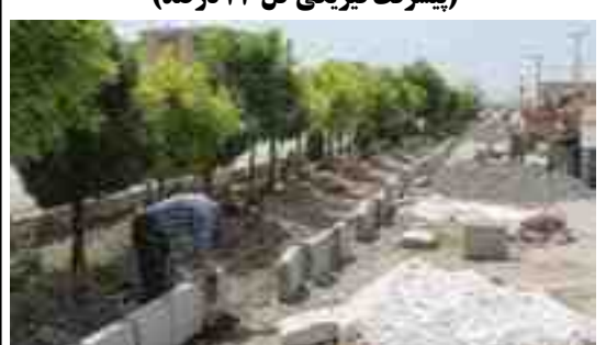
اقدامات انجام شده: بلوار هجرت حد فاصل خیابان شهید تاجیک تا تقاطع وحید ۱۱۰۰ متر از تقاطع خیابان وحید تا تقاطع بلوار قانی ۴۰۰ متر طول