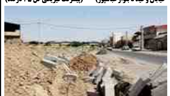
اقدامات انجام شده: جدولگذاری خیابان شهید فیاض بخش و خیابان عدل به طول ۲۴۰۰ متر