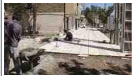
اقدامات انجام شده: اجرای جدولگذاری لاین شمالی بلوار فاطمیه از تقاطع بلوار نماز تا فرمانداری اجرای جدولگذاری لاین غربی بلوا مالک اشتر از تقاطع سیداحمد خمینی تا تقاطع صفارزاده لاین شمالی خیابان شریعی حد فاصل چهارراه سیاه تا میدان انقلاب - لاین شرقی و غربی تقاطع فرمانداری تا تقاطع مالک اشتر - عرضی جلو فرمانداری و سه تقاطع عرضی خیابان مالک اشتر دور تا دور پارک بنفشه - دال عرضی تقاطع مالک اشتر و صفارزاده