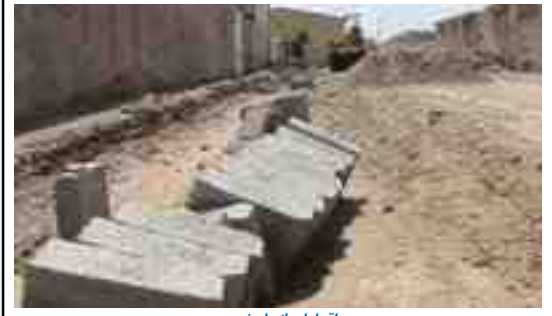
اقدامات انجام شده: اجرای جدول و کانو بول ۲ کوچه واقع در خیابان میرزا رضا به متر ۳۰۰ متر - اجرای جدول و کانو بول کوچه واقع در خیابان موسی بن جعفر حدود ۷۰۰ متر - کوچه هجرت ۳۱ - کوچه پشت دانشگاه پیام نور - کوچه واقع در شهرک فدک - خیابان سیاسی