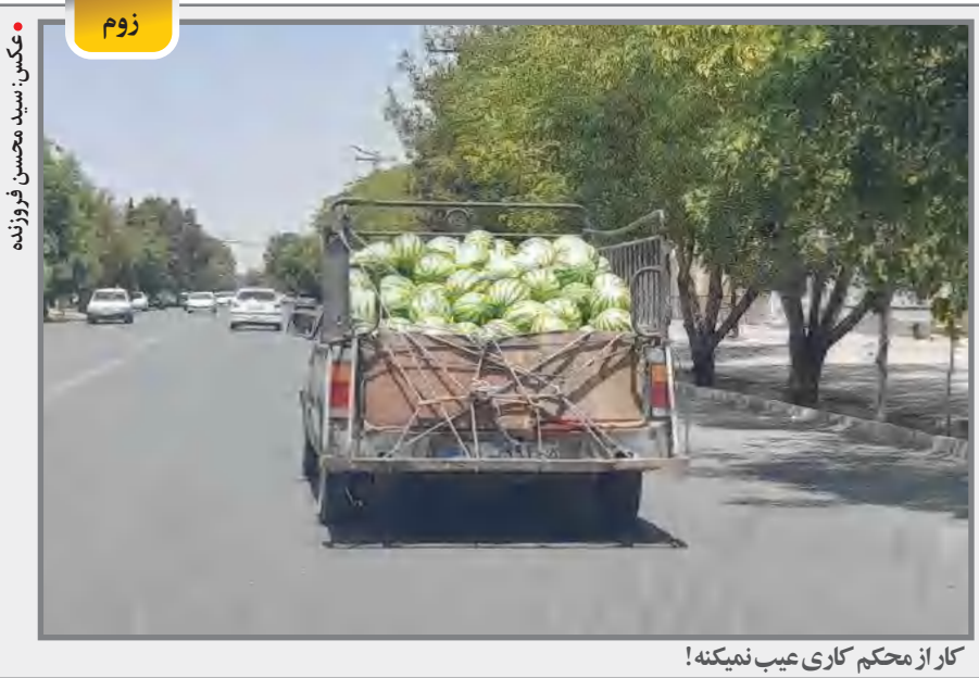
کار از محکم کاری عیب نمیکند!