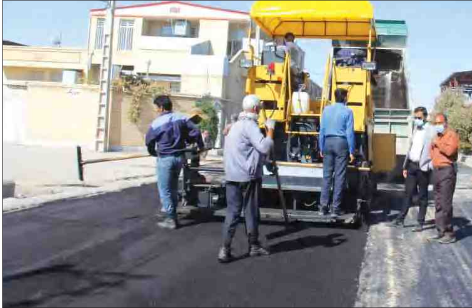
مشنوی هفته من کلابه‌ها

گلایه ساکنین شهرک‌های اطراف شهر از کوچه‌ها و خیابان‌هایی که آسفالت نشده زیاد است. یکی از ساکنین شهرک مس می‌گوید: کوچه ما ۱۰ سال است آسفالت نشده و ما باید تا به کی خاک بخوریم؟ یکی دیگر ساکن شهرک مشتاق و دیگری ساکن بلوار هجرت و شهرک مهندسی است و گلایه مند. یکی دیگر می‌گوید: جای تقدیر از شهردار و مسوولین شهرداری دارد که فضای سبز بلوار قائم که سال‌ها تارک بود و تبدیل به پارک و پیست پیاده روی شد اما وقتی از این بلوار گذر می‌کنیم کوچه‌های اطرافش که خاکی هستند و چهره زیبایی به آن مکان نمی‌دهد. بعضی‌ها می‌گویند: بعد از کلی گیرودار کوچه ما آسفالت شد اما طولی نکشید که اداره آب یادش افتاد که لوله آب را درست کند آسفالت کنده شد و دیگر ترمیم نشد، کم نیستند همشهریانی که از وضعیت کوچه‌های شان گل دارند.