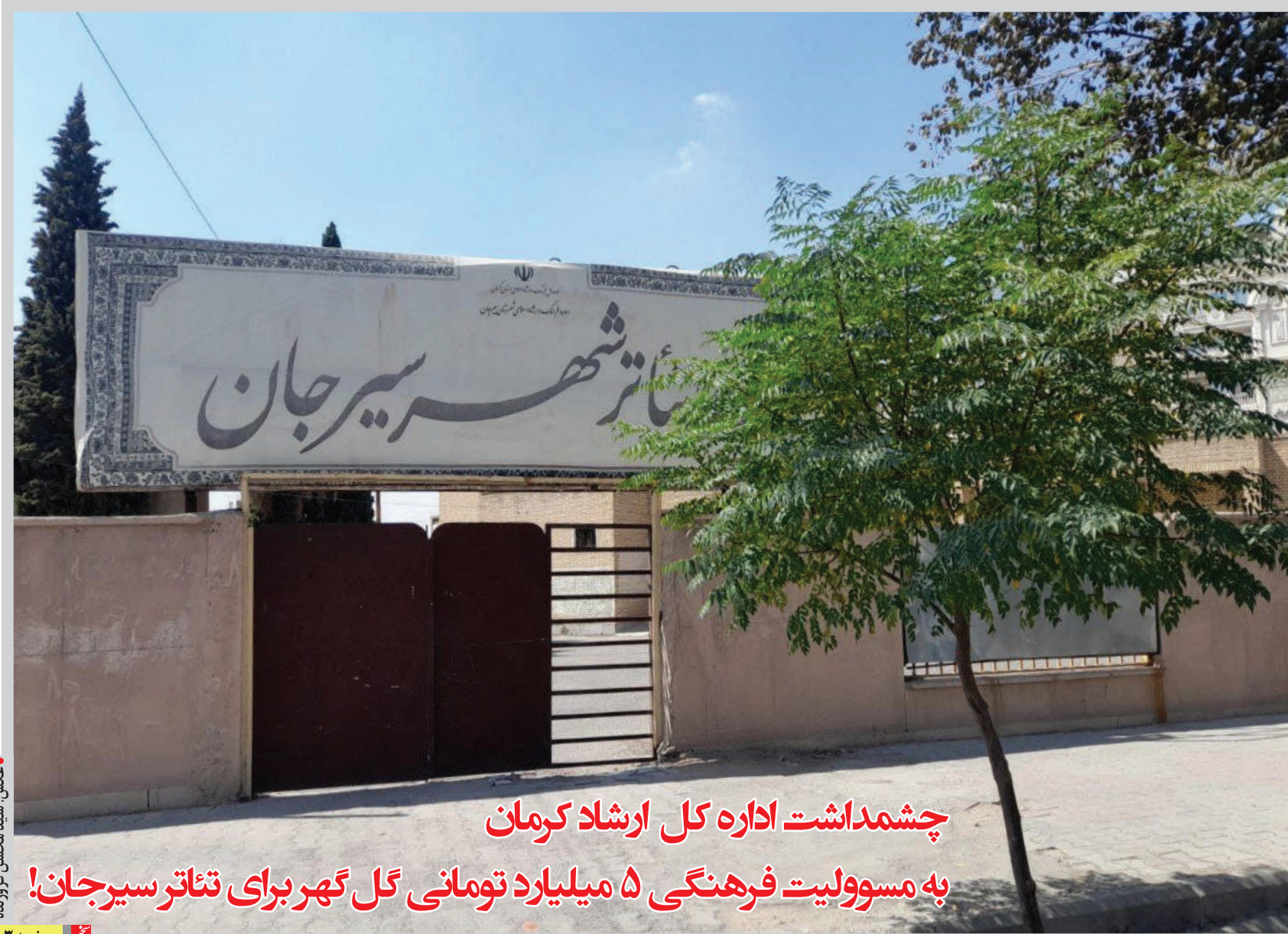
چشمداشت اداره کل ارشاد کرمان به مسوولیت فرهنگی ۵ میلیارد تومانی گل گهر برای تئاتر سیرجان!

■ یعنی یارانه دولت ما را برای بخش نان بیشتر اتباع بیگانه می‌خورند و ماها ناچاریم نان با قیمت ۱۰ هزار تومان و ۱۵ هزار تومان بخریم! ■ اکثر مردم سیرجان با درآمدهای معمولی رو به پایین، ناچار شده اند نان را از نانوایی‌های آزادپز با قیمت بالایی میان ۸ تا ۱۵ هزار تومانی تهیه کنند و در عمل می‌شود گفت از یارانه‌ی آردشان بهره‌ای نمی‌برند و این یارانه‌ی دولتی را اتباع بیگانه می‌گیرند!