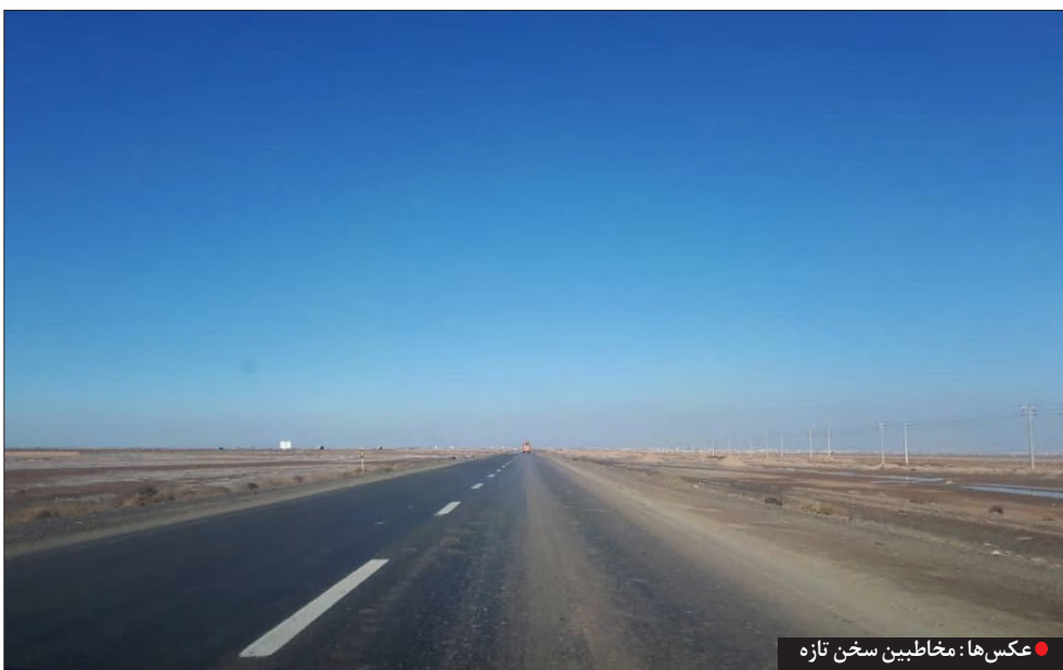
عکس‌ها: مخاطبین سخن تازه

را درباره‌ی علت لغزندگی بودن محور گل گهر-سیرجان بگویم: «در هر دو لاین این مسیر تریلرها و کامیون‌ها در حال رفت و آمد مرتب هستند و جاده را با لاستیک خود شلاق می‌زنند و فرسوده می‌کنند. اما مشکل لاین برگشت از گل گهر دوچندان است زیرا تریلرها به طور مرتب در حال جابه‌جایی کنستانتزه و آهن اسفنجی و... هستند. بارهایی که معمولاً در مسیر ریزش دارند، شما حاشیه‌ی جاده را در این مسیر نگاه کنید متوجه ریزش‌های آهنی می‌شوید. با کوچکترین بارندگی‌ئی ترکیب این خرده‌آهن‌ها با آب، حالت صابونی ایجاد می‌کند و موجب لغزندگی بیشتر جاده می‌شود.» اما راه حل رفع این مشکل چیست؟ نظر رییس اداره راه و ترابری شهرستان سیرجان این است: «یکی اینکه باید از این شرکت‌ها خواست بارشان را با استاندارد بیشتری حمل کنند تا ریزش کمتری داشته باشد و دیگر اینکه برای ریزش حداقلی هم باید دستگاه شست و شوی محور تهیه شود و این محورها هربار گردزایی بشوند.» می‌پرسم یعنی هزینه خرید دستگاه‌ها از معادن و اجرا با شما؟ پاسخش مثبت است.