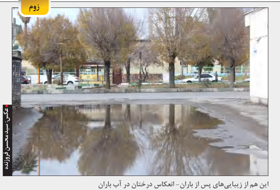
این هم از زیبایی های پس از باران - انعکاس درختان در آب باران

حالا که خوشبختانه سفرها به خاطر محدودیت ها تعطیل شده است و گزنی دوباره شاهد بستن بار و بندیل و زدن به دل جاده بودیم. تا حالا شنیده اید کسی به خاطر یک سال مهمانی نرفتن، مرده باشد؟ اما شنیده ایم که خانواده ای به خاطر مهمانی رفتن، به دیار باقی شتافته اند. شنیده ایم که داماد بعد از عروسی به جای عروس با مرگ هم بستر شده است. بله، حوصله سر می رود، دل مان برای اعضای خانواده و دوستان تنگ می شود و هزار مسئله دیگر اما ارزش زندگی و زنده ماندن بیش از همه این داستان هاست. کرونا دیر یا زود شش را کم می کند و ما می مانیم و بازگشت به زندگی به جای عروس با مرگ هم بستر شده است. آغوش بگیریم و از زندگی جمعی لذت ببریم. نباید آن زمان و ما حسرت نبودن نزدیکان مان را بخوریم و با خود بگوییم کاش به آن مهمانی نرفته بودم. کاش آن روز پدر بزرگ و مادر بزرگ را به شمال نبرده بودم. شک نکنید که کرونا تمام خواهد شد و سال هایی خواهند آمد که خاطرات آن را برای نسل های بعد تعریف می کنیم. خاطرات روزهای کرونا!