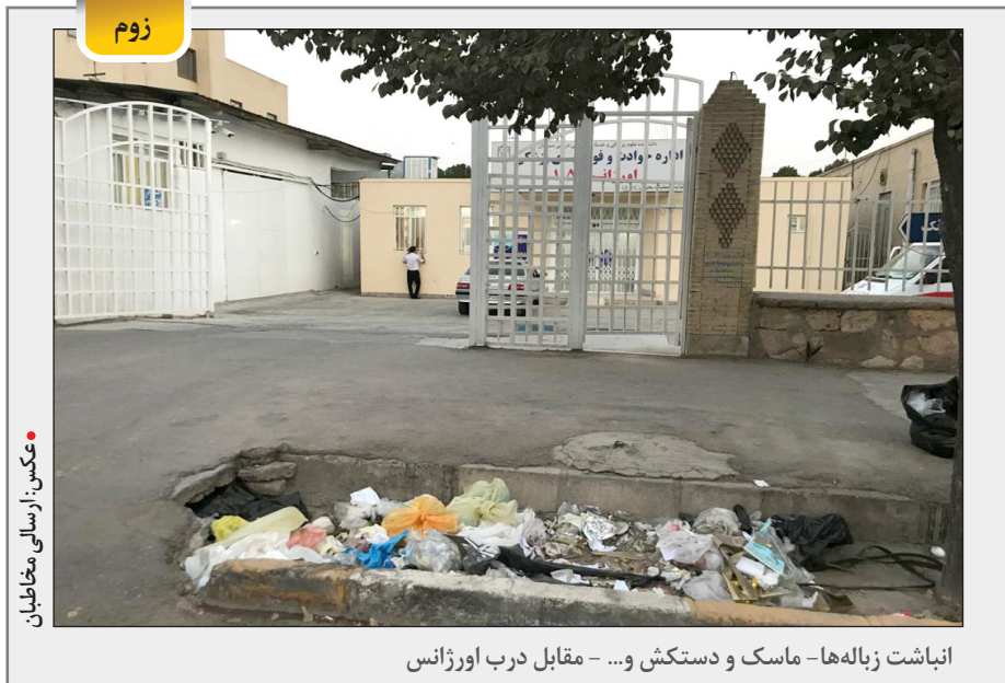
انباشت زباله‌ها - ماسک و دستکش و ... - مقابل درب اورژانس