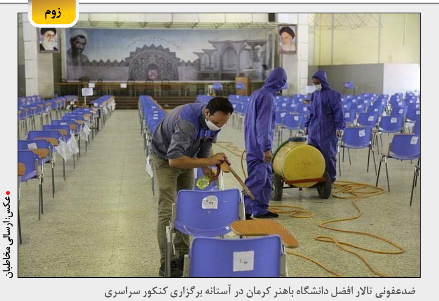
ضد عفونی تالار افضل دانشگاه باهنر کرمان در آستانه برگزاری کنکور سراسری

پایان: بی شک رفتار و موضع گیری بسیاری از نمایندگان مجلس شورای اسلامی با توجه به درک وضعیت کشور و آشنایی بیشتر با حدود اختیارات دولت و شناخت دقیق تر امکانات مالی کشور تغییر خواهد کرد. حداقل آنکه کمتر شاهد رفتارهای هیجانی در ماه های آینده خواهیم بود ولی این همه زمینه ساز وحدت اصولگرایان نخواهد شد.