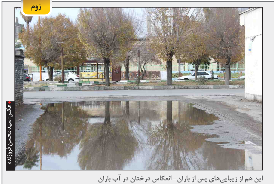
این هم از زیبایی های پس از باران - انعکاس درختان در آب باران

آغوش بگیریم و از زندگی جمعی لذت ببریم. نباید آن زمان و ما حسرت نبودن نزدیکان مان را بخوریم و با خود بگوییم کاش به آن مهمانی نرفته بودم. کاش آن روز پدر بزرگ و مادر بزرگ را به شمال نبرده بودم. شک نکنید که کرونا تمام خواهد شد و سال هایی خواهند آمد که خاطرات آن را برای نسل های بعد تعریف می کنیم. خاطرات روزهای کرونا!