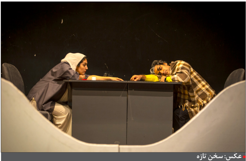
عکس: سخن تازه