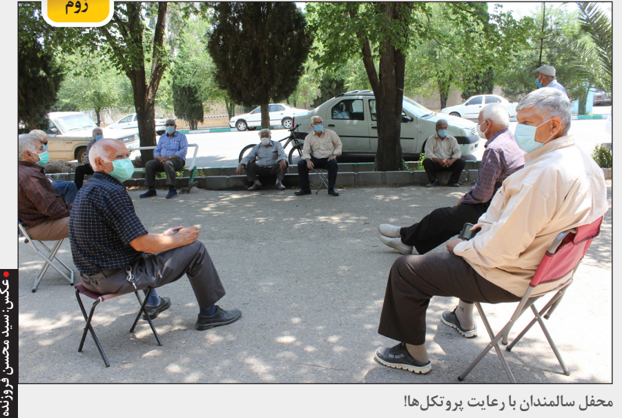
محفل سالمندان با رعایت پروتکل‌ها!

درست مثل راهپیمایی ۲۲ بهمن که گزارشگران برای نشان دادن تنوع حاضران در مراسم پیروزی انقلاب اسلامی، سراغ دخترانی می‌روند که کم حجاب‌تر از دیگران هستند. دخترانی که در این روزها مورد سوال قرار می‌گیرند، همان صداسیمایی که در هنگام پیش سریال‌هایی که خودش ساخته و یا فیلم‌های سینمایی ایرانی که از وزارت ارشاد مجوز دارد، رنگ تصویر صحنه‌هایی که بازگویی زن در آن آرایش غلیظ دارند را تا حد سیاه و سفید پایین می‌آورد، دختران کم حجاب دم انتخابات را رنگی، رنگی نشان می‌دهد. اصلا در ایام انتخابات، هرچه بی‌حجاب‌تر باشی احتمال اینکه دوربین تلویزیون به سمت شما بیاید زیاد است. اگر حرف‌های مورد نظر آنها را هم که بگویی کار تمام است و می‌توانید تلفن را بردارید و به همه خبر بدهید که در اخبار ۲۰:۳۰ شما را نشان خواهند داد. احتمالا وقتی به پدر زنگ بزنید او به شما خواهد گفت که «کنکه دوباره گشت ارشاد گرفت؟» شما با لحنی فاتح می‌گویید نه در مورد انتخابات و انتظار داریم از رییس جمهور حرف زد، درست با همان ظاهری که ماه پیش مهمان ون گشت ارشاد شدم. کاش که این نگاه همیشه وجود داشت و فقط منحصر به روزهای انتخابات و راهپیمایی نبود. واقعا اگر این دختران و یا پسرانی که ظاهری متفاوت با دیگران دارند را فرزندان این کشور می‌دانید و رای و نظر آنها برای‌تان مهم است، در ماه‌های دیگر سال هم با این جوانان همینگونه برخورد کنید و اگر آنها را از خود نمی‌دانید در زمان انتخابات هم به سراغشان نروید. این داستان تکراری شده است، تکراری تر از تمام فیلم‌های آی‌فیلم. کاش تکلیف ما را بد حجاب خوب و بد حجاب بد، مشخص می‌کردند.