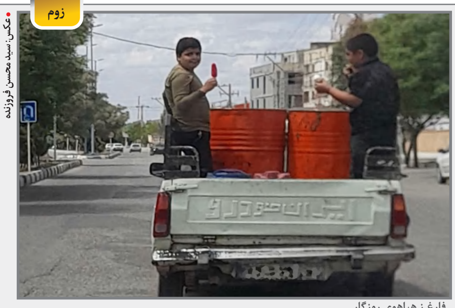
فارغ ز هیاهوی روزگار