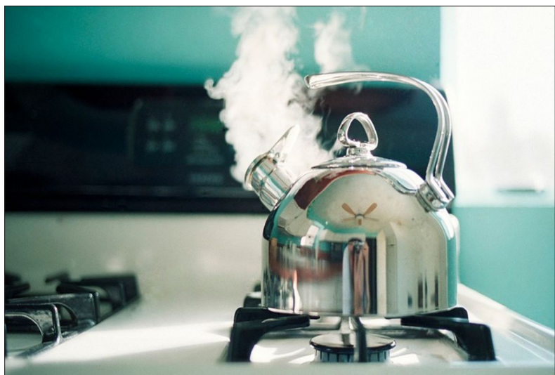
شما تحویل داده می شود که از نظر مقدار کم مواد حل شده در آن مناسب شما تحویل داده می شود. پس آب تصفیه شده آب سبک (کم املاح) و آب جوشیده آب

سنگین (پر املاح) است. اما اینکه چنین پندار اشتباهی در میان عموم مردم سیرجان از کجا حاصل شده است شاید یک دلیلش اشتباه گرفتن مفاهیم پیرامون آب آلوده با هم است. در اینجا مفاهیمی مثل آب ضد عفونی شده با آب تصفیه شده و آب مقطر با هم اشتباه گرفته شده اند. آب ضد عفونی شده یعنی آبی که میکروب های بیماری زای احتمالی در آن با جوشاندن از بین رفته باشد اما کشتن میکروب ها به هیچ عنوان موجب از بین رفتن املاح حل شده در آب کتری نمی شود و حتی املاح آب مدنظر شما را بیشتر می کند و در نهایت این املاح را شما در کتری مشاهده می کنید و به آن سارد بستن کتری می گویند.