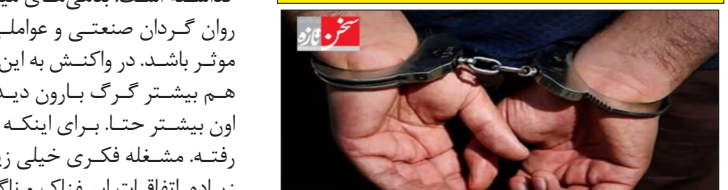
قتل کشفه و در پی از خانه باغ های کاران اتفاق افتاد. مرگ مشکوک زن و شوهر میانسال دستگیری عامل تیراندازی منجر به ق/تل در سیرجان