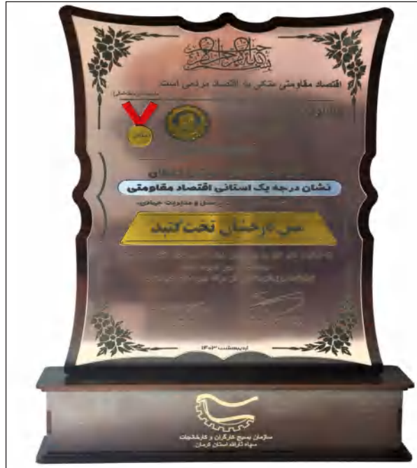
روابط عمومی شرکت فرآوری مس درخشان تخت گنبد

کسب این موفقیت بوده است. شرکت فرآوری مس درخشان تخت گنبد تاکنون موفق به اشتغال افزون بر ۲۶۰۰ نفر شده که بیش از ۹۰ درصد نیروها را افراد بومی منطقه در سیرجان و شهرستان های اطراف بافت و بردسیر تشکیل می دهند و در گام های بعدی توسعه نیز امکان اشتغال بالغ بر یک هزار نفر دیگر محقق خواهد شد.