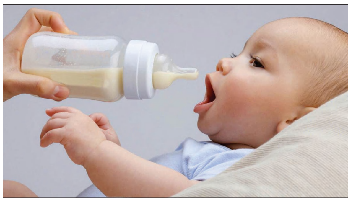
قول مساعد، برای رفع کمبود

شرکت‌های توزیع کننده‌ی آن، مشخص و از آن پس هر شهرستان پیگیر توزیع آن، می‌شود. اما در مورد برخی از برندهای شیرخشک، که در برخی داروخانه‌ها اصلا توزیع نمی‌شود، باید گفت که یا به دلیل بدهی آن داروخانه به شرکت توزیع کننده است و یا اینکه آن داروخانه، تقاضای آن شیرخشک را نداشته. پس سهمیه‌ی شیرخشک آن داروخانه، به داروخانه‌ای که تقاضا دارد توزیع می‌شود و این سهمیه به هیچ عنوان سوخت نمی‌گردد. و در رابطه با برخی از برندهای شیرخشک باید گفت که از مرداد ماه تاکنون از سازمان توزیع نگردیده است و همین دلیل کمبود کشوری آن شیرخشک می‌شود. به هر صورت، کمبود کشوری است و باید این موضوع به صورت کشوری رفع گردد تا آن موقع توزیع بر اساس سهمیه‌های هر شهرستان صورت و کمبودها رفع گردد.