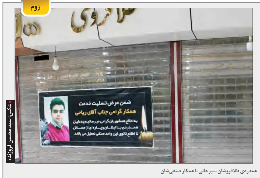
همدردی طلافروشان سیرجانی با همکار صنفی شان