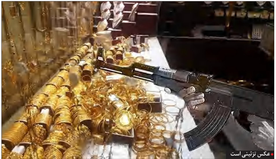
عکس تزئینی است

تحلیلی بر چرایی وقوع جرم و خشونت در جامعه سرتقت مسلحانه از جمله جرایمی است که معمولا با جرایم دیگری همچون ضرب و جرح و قتل همراه است. این رویداد تهدید کننده علاوه بر پیامدهای جسمی، روانی و مختل کردن عملکردهای شغلی و اجتماعی قربانیان حادثه، به شدت احساس امنیت عمومی و اجتماعی، آرامش ذهنی و سلامت افراد جامعه را به خطر می‌اندازد. اختلالاتی چون دلهره پس از سانحه (PTSD) که طی فرد با یادآوری مکرر واقعه تهدید کننده مجددا به صورت ذهنی آن را تجربه کرده و دچار تنش و پریشانی می‌شود. اضطراب، افسردگی و در موارد حادتر سوگ از دست دادن عزیز، از دیگر مهمترین واکنش‌های روانشناختی قربانیان و یا شاهدان عینی این حوادث بوده و نیاز به حمایت و تسکین، همدلی و در مواردی خدمات روانشناختی را برای آنها ضروری می‌سازد.