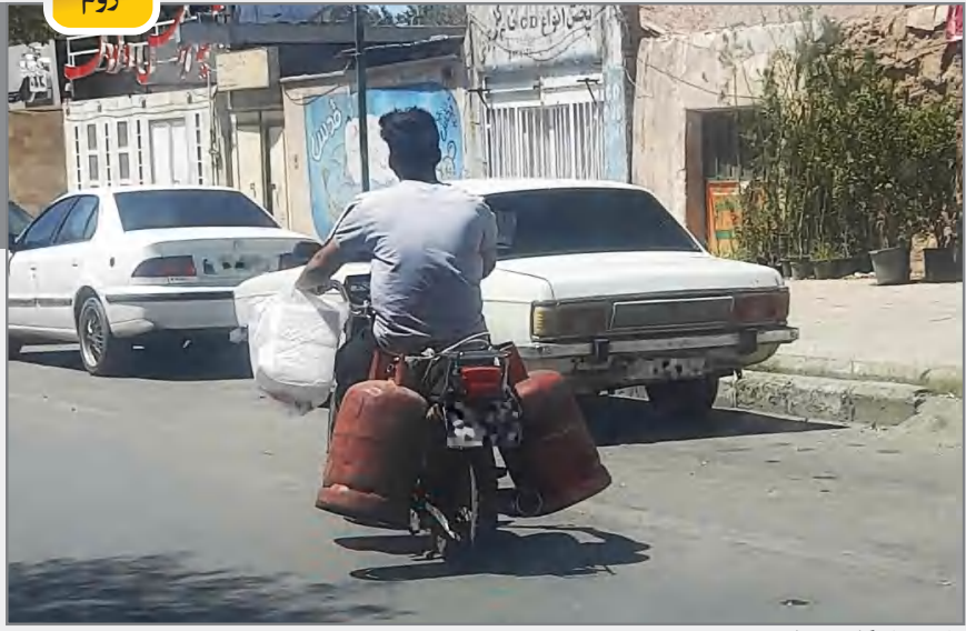
کپسول گاز به جای خورجین!