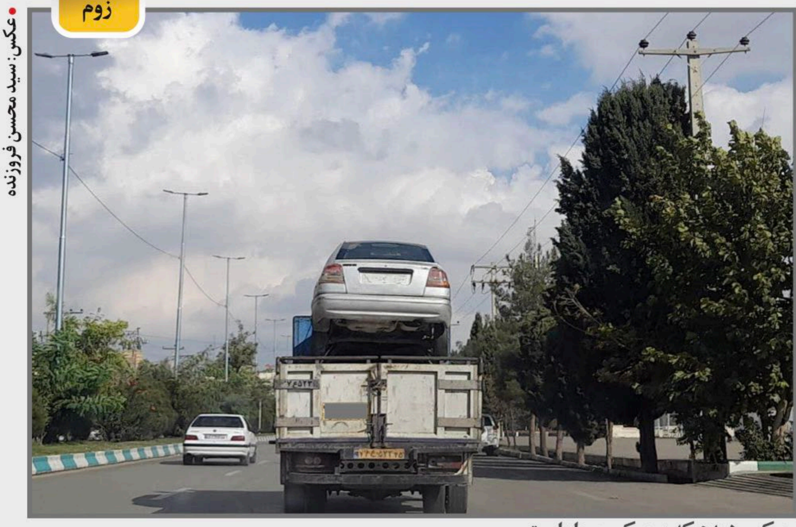
مورکی دیدم که پر مرکب سوار است