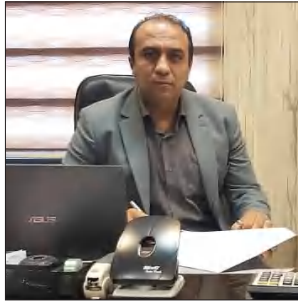
مدیرعامل سازمان مشاغل شهرداری: طبق قانون عمل می‌کنیم

شنبه اول مرداد تعدادی از قصاب‌های سیرجان طی تماسی با سخن تازه، خبر از فاسد شدن گوشت‌های کشتار شده روز جمعه در دستگاه پیش‌سرد کشتارگاه دادند و مدعی بودند که این گوشت‌ها بوی نامطبوعی گرفته و آنها را به هیچ وجه توزیع نمی‌کنند زیرا هم سلامتی مردم به خطر می‌افتد و هم اعتبار و کاسبی شان آسیب می‌بیند. این تعداد مدعی بودند که شهرداری موظف است خسارت آنها را پرداخت کند.