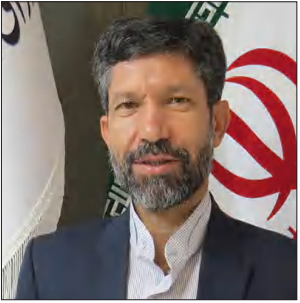
رییس شورای شهر سیرجان: قصاب نباید متضرر شود

کشتار داده‌اند. وی افزود: فرایند نظارت و اجرای کشتار بر عهده دامپزشکی است و باید مجوز کشتار به لحاظ تعداد و طبق شرایط و ظرفیت دستگاه پیش‌سردکن داده شود. گفتنی است در این نشست تعدادی از قصابان نیز به بیان مشکلات و مسائل و نقطه نظرات خود پرداختند.