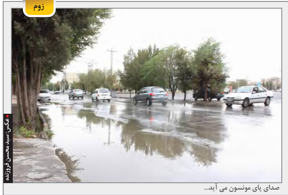
صدای پای مونسون می آید...

۲- تعطیلی برجام دومین هدف پوتین برای درگیر نمودن تدریجی ایران در اوکراین، تعطیلی همیشگی برجام است. این مهمی است که کرملین تا امروز به خوبی در آن تاثیر نهاده است. ژرف تر شدن بی اعتمادی بین ایران-آمریکا - اروپا عملا احیای برجام و لغو نشدن تحریم‌های ایران را در پی خواهد داشت. با چنین روندی برجام مرده است؛ ۳- نبود جانشین نفتی بزرگترین اسلحه روسیه در وادار نمودن ناتو به تسلیم، قطع نفت- گاز است؛ و بهترین جانشین برای پرکردن این خلا ایران، ونزوئلا و عربستان. ورود تمام قد ایران به بازار نفت نجات بخش اروپا است. روس ها حتی از همه اهرم های ممکن در جهت عدم ورود فراگیر و گسترده ایران به بازار انرژی که کلید شکستشان در اوکراین است بی تعارف و پنهان سازی استفاده خواهند کرد. کوتاه آن که روسیه نیازی به پهناد های ایران ندارد، هدف کشاندن جمهوری اسلامی به صحنه جنگ و وارد کردن شریک جرم بین المللی است.