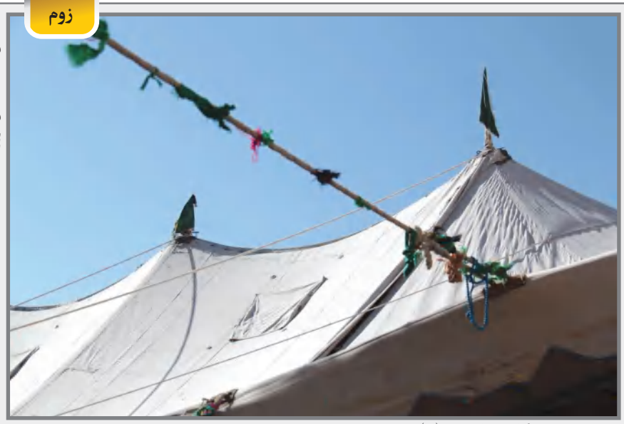
دخیل به خیمه گاهت یا حسین (ع)