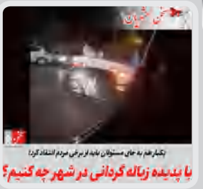
تشریح به حال مسئولان بعد از بررسی مردم استند کرد یا پدیده زباله گردانی در شهر چه کنیم؟