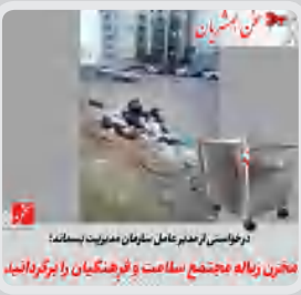
بررسی در آزمایشگاه مواد معدنی و صنایع مخبرین زباله جمعیت سلامت و فرهنگیان را بر گرداند

این هم بی فرهنگی برخی از همشهریان بی فکر، با این زباله ها اینقدر رانندگی میکنن تا یجا بیفته !! از تقاطع ولی عصر تا انتهای ولی عصر پشت سر ماشین بودم ، ده تا سطل زباله هم سر راهش بود اما به لحظه توقف نکرد زباله هاش رو خالی کنه . شایدم کلا فراموش کرده بود بد نیست بعضی وقتا هم به جای مسئولین از خودمون انتقاد کنیم کاش یاد بگیریم پدیده زباله گردانی در شهر کار درستی نیست. #انتقاد#حق#مردم#است