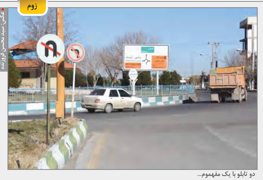
دو تابلو با یک مفهوم...

وی با تأکید بر لزوم برخورد با فساد در صنعت، گفت: اگر در بخش برخورد