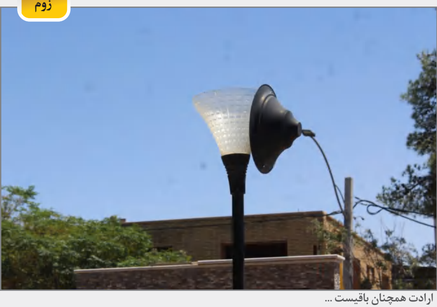
آرادات همچنان باقیست ...