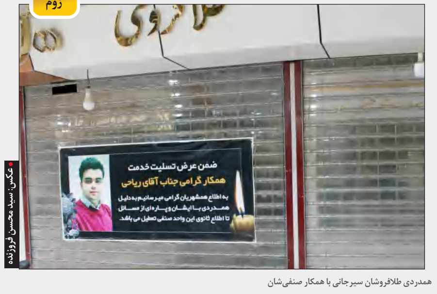
همدردی طلا فروشان سیرجانی با همکار صنفی شان

بعد از پیروزی روحانی در دوره دوم ریاست جمهوری و در بیش از ۳ سال ونیم گذشته متأسفانه عملکرد روحانی بیشترین لطمه به جایگاه اصلاح طلبان وارد کرد. واعظی به گونه ای صحبت می کند که انگار اصلاح طلبان فقط و فقط برای اینکه به پست و مقام برسند و معاون استاندار یا فرماندار و معاون وزیر بشوند، با روحانی همکاری کردند و او می گوید که ما به تعدادی از اصلاح طلبان پست و مقام دادیم و اصلاح طلبان حق گلابه ندارند. درحالی که واعظی فراموش کرده که اگر اصلاح طلبان از عملکرد روحانی در دوره دوم ریاست جمهوری او انتقاد می کنند، به خاطر این نبود که چرا اصلاح طلبان در دولت مقام نگرفتند. گلابه ما که اتفاقاً باید با صدای هرچه بلندتر بیان شود، برای این است که روحانی و سایر نزدیکان روحانی به مطالبات ۲۴ میلیون نفری که به او رای دادند چندین عمل نکردند. انتقاد اصلاح طلبان از روحانی به واسطه این نیست که چون ما باعث پیروزی شما شدیم، به دنبال سهم خواهی هستیم، ما اگر از دولت انتقاد می کنیم، بابت این است که مطالبات ۲۴ میلیونی را که به او رای داده اند در نظر نگرفته است. آقای واعظی ما اگر دولت روحانی انتقاد می کنیم برای این است که حتی یکی از آن ۲۴ میلیونی که به شما رای دادند، دیگر حاضر به مشارکت فعال نیستند. این ها گلابه از عملکرد رییس جمهور است و اصلاح طلبان اصلاً به دنبال سهم خواهی از دولت نبوده اند.