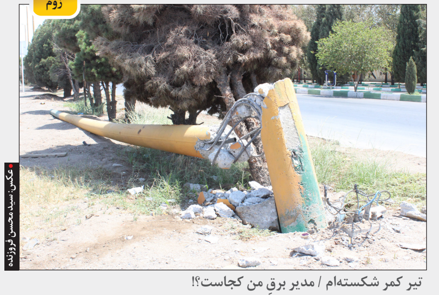
تیر کمر شکسته‌ام / مدیر برق من کجاست؟! / مکتب سیدالشهدا نوروزانه

رئیس کمیسیون اصل ۹۰ مجلس شجاعی، گفت: این فیلم‌ها در طی چند سال اخیر توسط دوربین‌های زندان اوین ضبط شده بود و متأسفانه از آرشیو این مجموعه خارج شده است و این فیلم‌ها مربوط به سال ۹۵ تا ۹۹ است. حجت الاسلام و المسلمین شجاعی ادامه داد: تخلف در زندان اوین محرز است و ما به این جمع بندی رسیدیم که خاطیانی در این پرونده وجود دارند و حتماً باید با این خاطیان برخورد شود. وی گفت: به نظر ما بررسی‌ای که زندان اوین یا زندان‌های جمهوری اسلامی ایران نیست، آنچه که دشمنان ما امروز تبلیغ می‌کنند که اراده‌ای در زندان‌ها و مدیران میانی است. به نظر