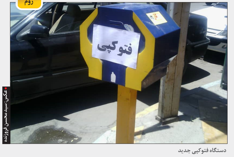
دستگاه فتوکپی جدید