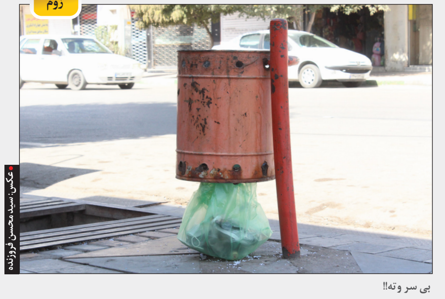
مکس سبیل محسنی فرزنده بی سر و ته!!