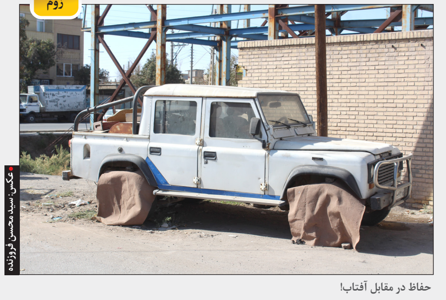
حفاظ در مقابل آفتاب!

مناسبت نام گذاری هفتم آبان یا ۲۹ اکتبر به سبب آن است که به عنوان روز ورود کورش به بابل در ۵۳۹ پیش از میلاد از آن یاد می شود؛ روز آزادی بردگان و نگارش استوانه بابلی این پادشاه هخامنشی والبتنه به عنوان شناسه اختصاصی ایرانیان. واقعیت این است که حساسیت و مخالفت علنی با یادکرد کورش به