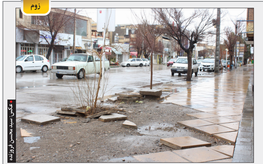
زیبایی شهر ما در روز بارندگی!

رئیس مرکز ملی خشکسالی و مدیریت بحران سازمان هواشناسی افزود: اوج بارش ها در روزهای جمعه و شنبه هفته آینده برای استان های لرستان، خوزستان، چهارمحال و بختیاری، کهگیلویه و بویراحمد، کردستان، آذربایجان شرقی و آذربایجان غربی است. وظیفه تأکید کرد: به تدریج این سامانه بارشی مناطق مرکزی کشور را در بر می گیرد. هفته بعد نیز در جنوب شرق کشور از جمله هرمزگان، سیستان و بلوچستان و مناطق جنوبی فارس، بارش های خوبی خواهند داشت.