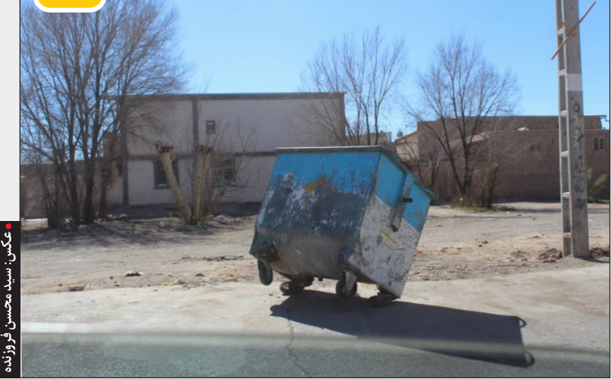
چرخ نظافت شهر لنگ می زند!