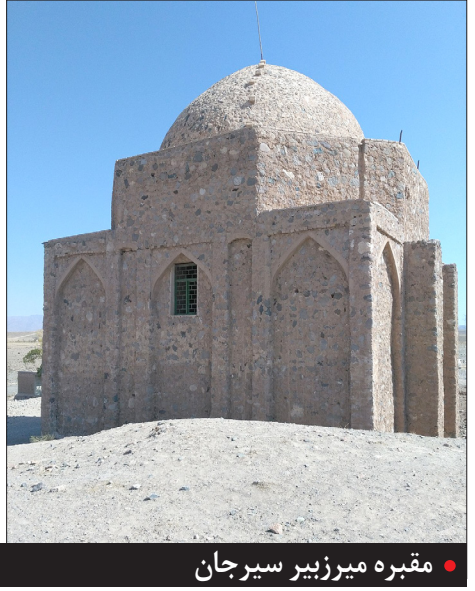
مقبره میرزبیر سیرجان