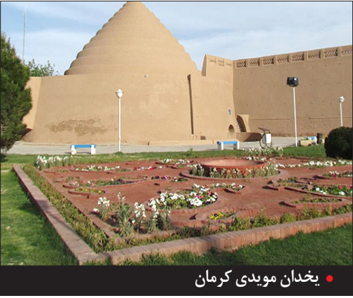
یخدان موییدی کرمان

از سوی دیگر دیده نشده که اداره‌ی به هیچ گرفته شده‌ی میراث فرهنگی در سیرجان بکوشد که جلسات منظمی با شرکت‌های معدنی یا شورای شهر و شهرداری و حتا اصناف مربوط به حوزه‌ی کاری میراث داشته باشد تا بخواهد از ظرفیت‌های مالی و تعاون این مجموعه‌ها یاری بطلبد و دلسوزانه کاری را پیش ببرد. ماحصل این بی‌مسوولیتی‌ها و بی‌توجهی‌ها چه بوده جز شرایط وخیم و لب مرز نابودی میراث فرهنگی در سیرجان.