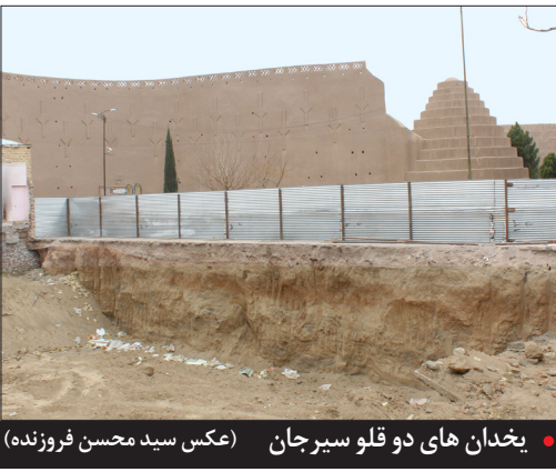
یخدان‌های دو قلو سیرجان