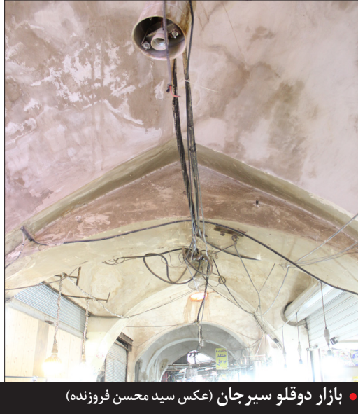
بازار دوقلو سیرجان (عکس سید محسن فروزنده)