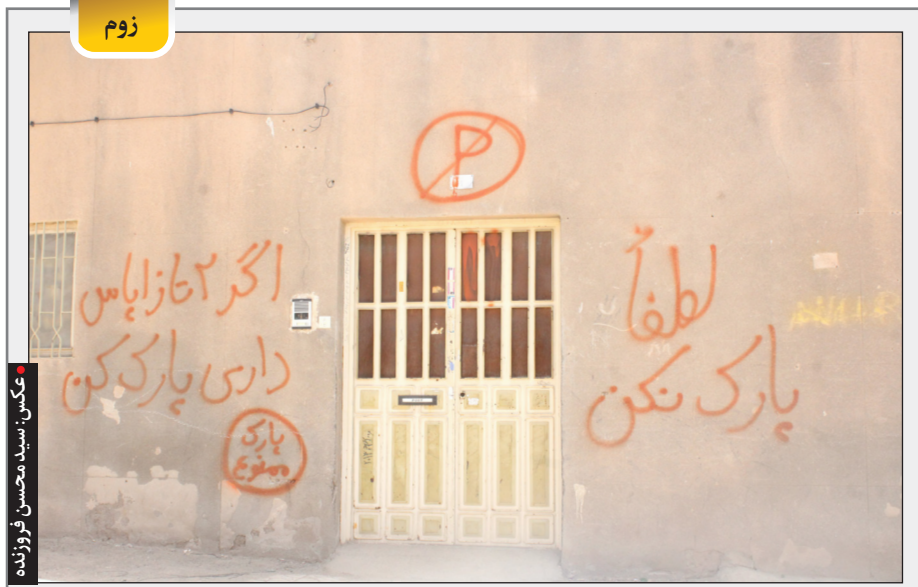
دو تا زاپاس داری پارک کن!

از این رو می توان گفت "داد" گستری از موثرترین استراتژی های ارتقای سلامت جامعه است. عدالت اجتماعی برای تضمین دسترسی عادلانه افراد جامعه و چه بسا دسترسی بهتر و بیشتر افراد محروم جامعه مهم تر از ارائه خدمات بهداشتی درمانی برای کاهش مرگ و میرهای زودرس و ابتلاء به بیماری های افراد محروم جامعه است. لذا توجه و اقدام جهت وضعیت عدالت در جامعه نه تنها از منظر امنیت ملی، سیاسی و دینی، از منظر سلامت نیز امری حیاتی است.