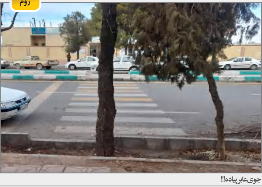
جوی عابر پیاده!!!

کسانی که می‌توانستند بروند و بجنگند ولی نرفتند و نجنگیدند، بهتر است دستکم در این باب سکوت کنند و فاز مجاهدین اسلام را برندارند و به باغ و مدرسه و هتل و ... بپردازند! زیاده عرضی نیست!