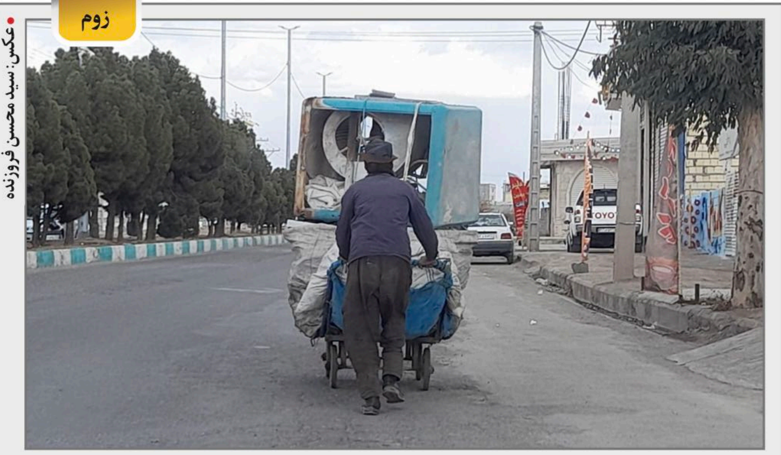
از حلاله به فکر تابستونه!

در پایان، نصیحتی به این افراد دارم: کاری نکنید که باعث روسیاهی شما شود. مراقب باشید که ابزار دست کسانی نشوید که تنها به منافع شخصی خود می‌اندیشند. مبادا رفتارهاییان به‌گونه‌ای باشد که تاریخ، شما را در زمره کسانی قرار دهد که در دوره‌های مختلف، از مشروطه و ملی‌شدن صنعت نفت گرفته تا انقلاب اسلامی و امروز، در بحران‌سازی و تندروی نقش داشته‌اند.