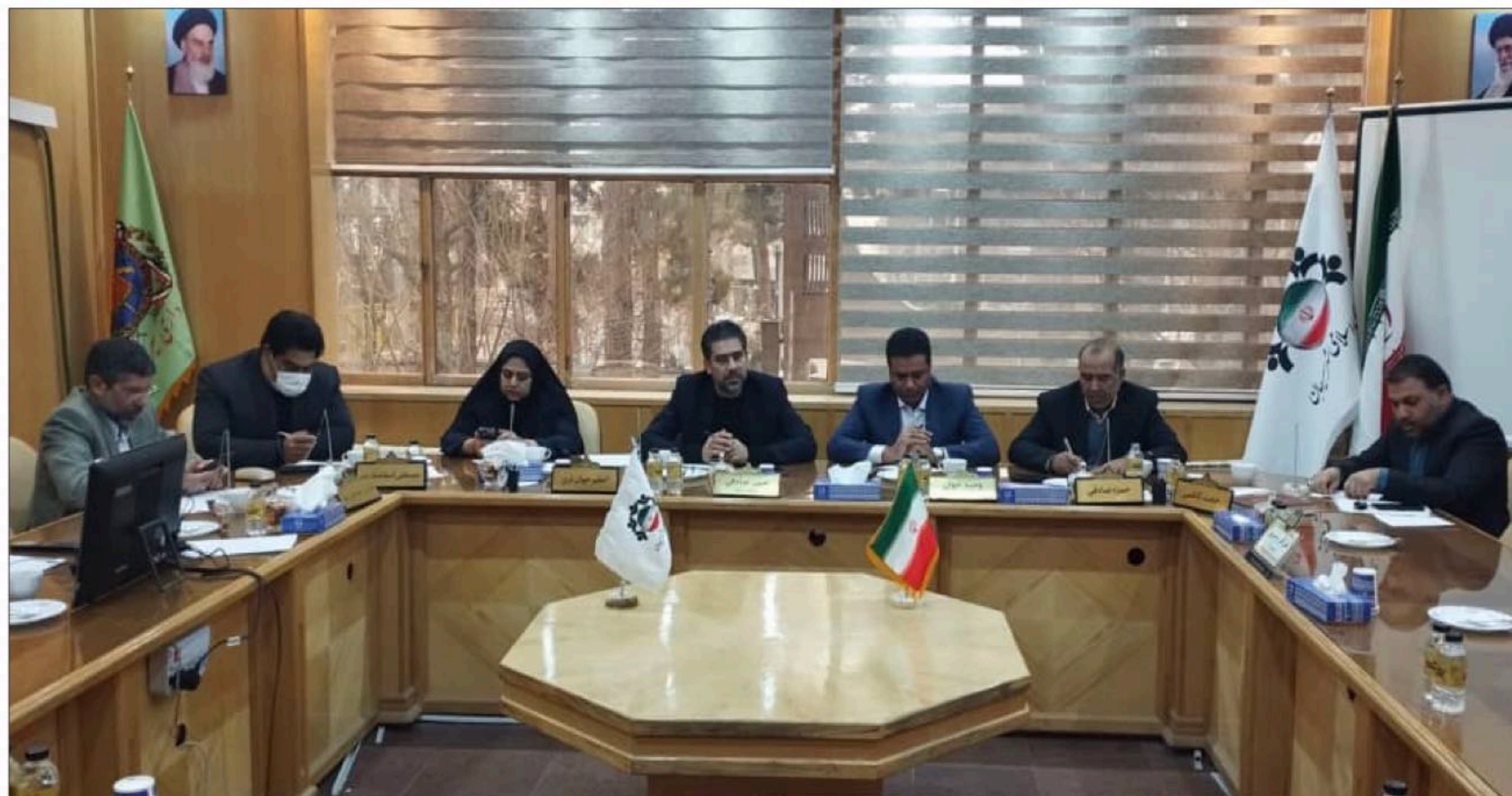
از میدان پلیس‌راه تا پل کرم فتحی زاده با اعتبار ۳۵ میلیارد تومان درحال انجام است.

آنان ضمن انتقاد از صنوف مزاحم خطاب شدن توسط شهرداری، بر زحمتهای چندساله‌شان در کمربندی اشاره کردند و خواستار رسیدگی شدند و به شورا اعلام کردند که شهرداری تاکید کرده که فقط مجری است و نیاز است شورای شهر دستور توقف کار و پروژه‌ی اجرایی توسط شهرداری را بدهد. موضعی شفاف از سوی شهرداری که البته حسن خدای آن را تفسیر به انداختن توپ در زمین شورا کرد و گفت: شهرداری قصد دارد توقف