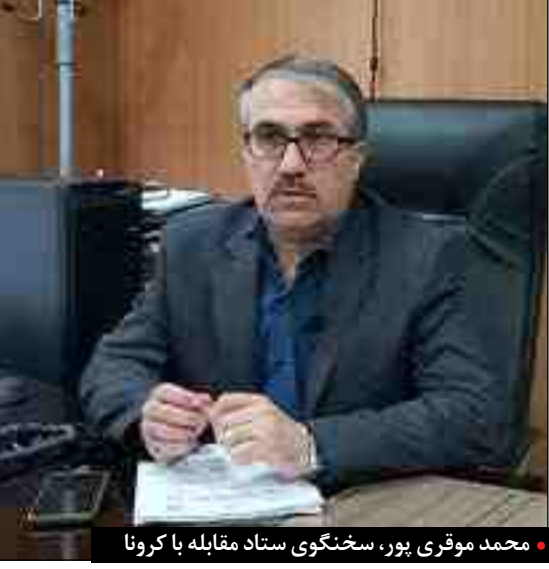
محمد موقری پور، سخنگوی ستاد مقابله با کرونا