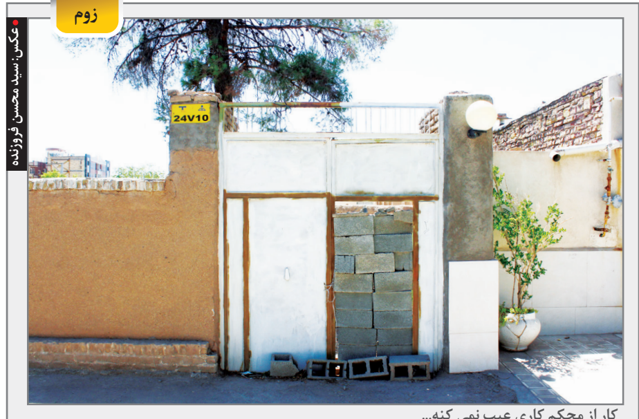
کار از محکم کاری عیب نمی‌کند...