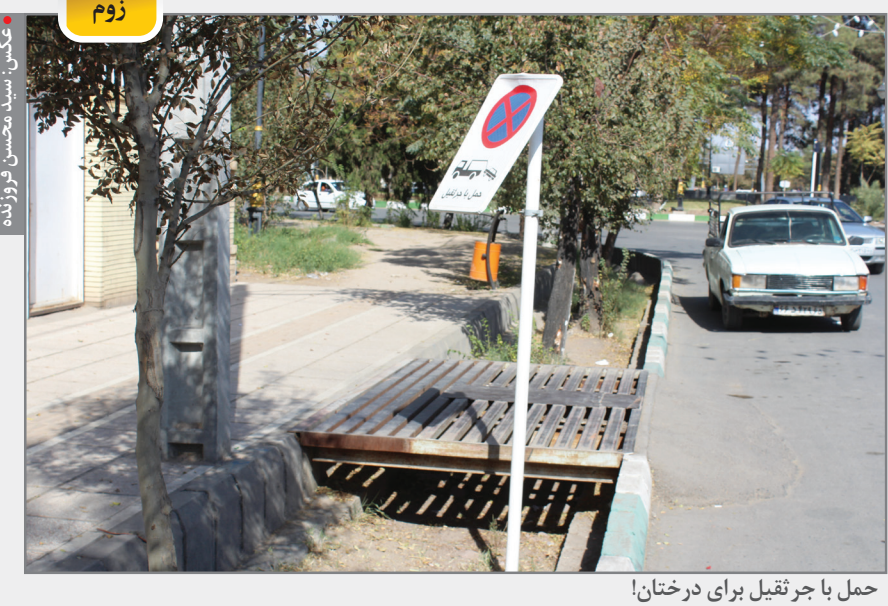
حمل با جرثقیل برای درختان!

اگر روند به همین گونه ادامه پیدا کند، رسانه‌ها در ایران بیشتر از بیش اعتبار و مرجعیت خود را در بین مردم از دست می‌دهند و با توجه به سانسوری که در صداوسیما وجود دارد و فقط صدای جریانی خاص شنیده می‌شود، باید منتظر مرجعیت خبری شبکه‌هایی مثل ایران اینترنشنال و بی بی سی باشیم.