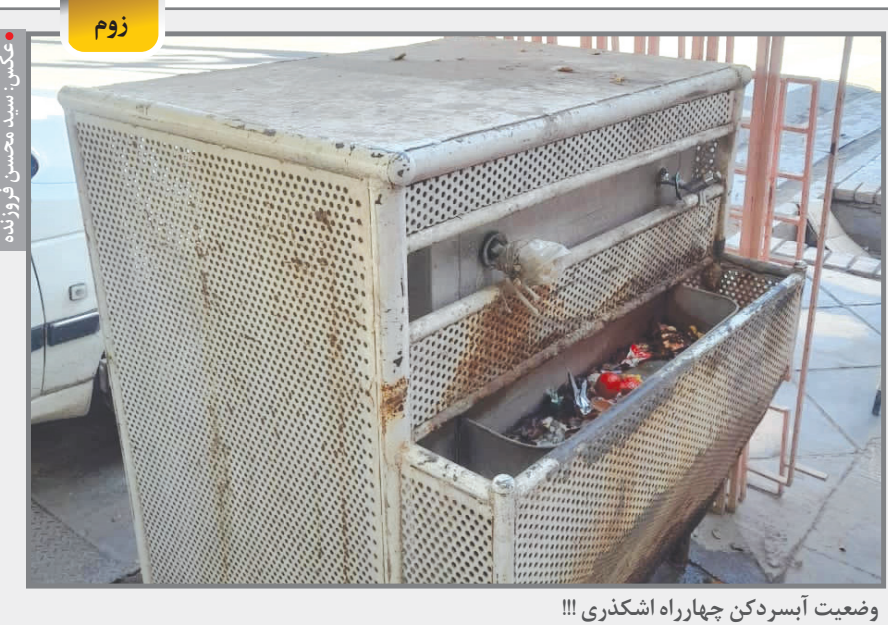
وضعیت آب سردکن چهارراه اشکذری !!!