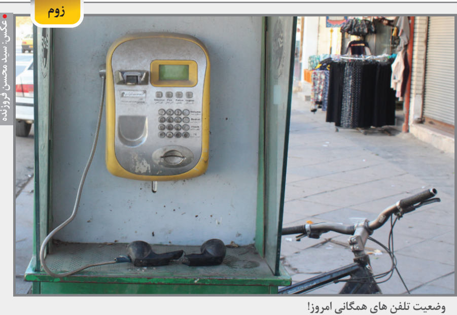
وضعیت تلفن های همگانی امروز!