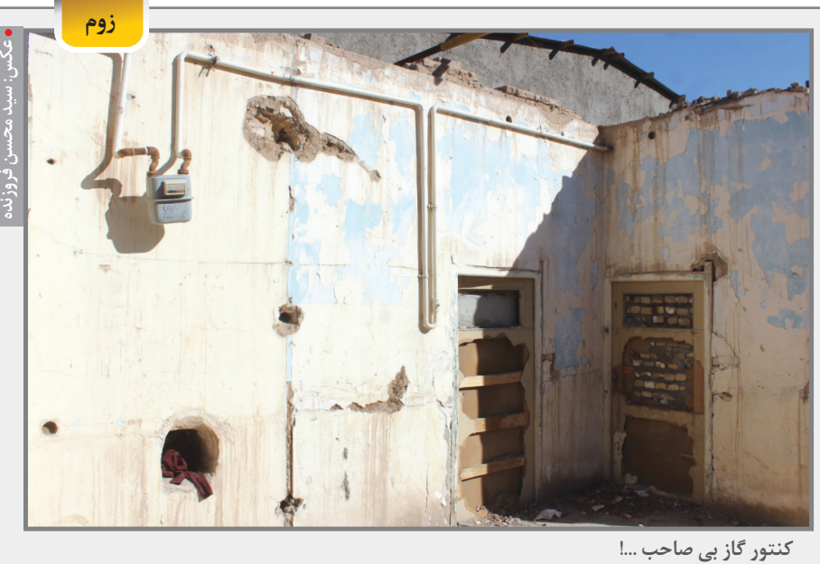
کتور گاز بی صاحب ...!