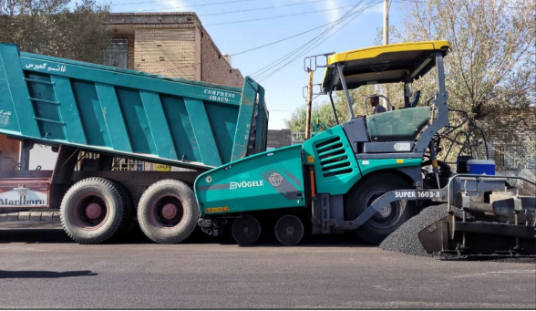
مدت‌هاست بهسازی آسفالت فرسوده خیابان شهید عباسپور از خیابان‌های پرتردد شهر، جزو درخواست‌های مکرر شهروندان از شهرداری سیرجان است.