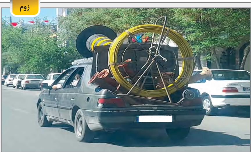
به کجا چنین شتابان!

ویتکاف چندی پیش و در واکنش به پیام عراقچی در ایکس مبنی بر این‌که «ایران بار دیگر تأکید می‌کند که هیچ‌گاه و تحت هیچ شرایطی به دنبال جستجو، تولید و یا تست آوردن سلاح هسته‌ای نخواهد بود» در کامنتی نوشت «عالی»؛ کامنتی که چند دقیقه بعد حذف شد.