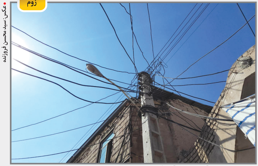
وضعیت سیم‌های برق ابتدای بازار قهوه فروشان