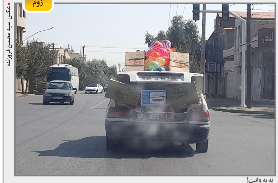
نه به وانت!