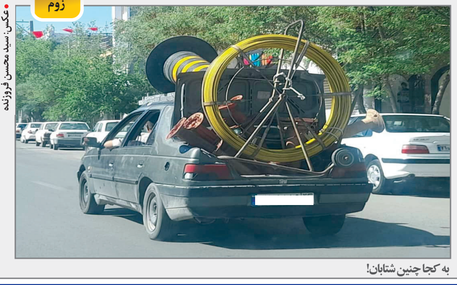
به کجا چنین شتابان!