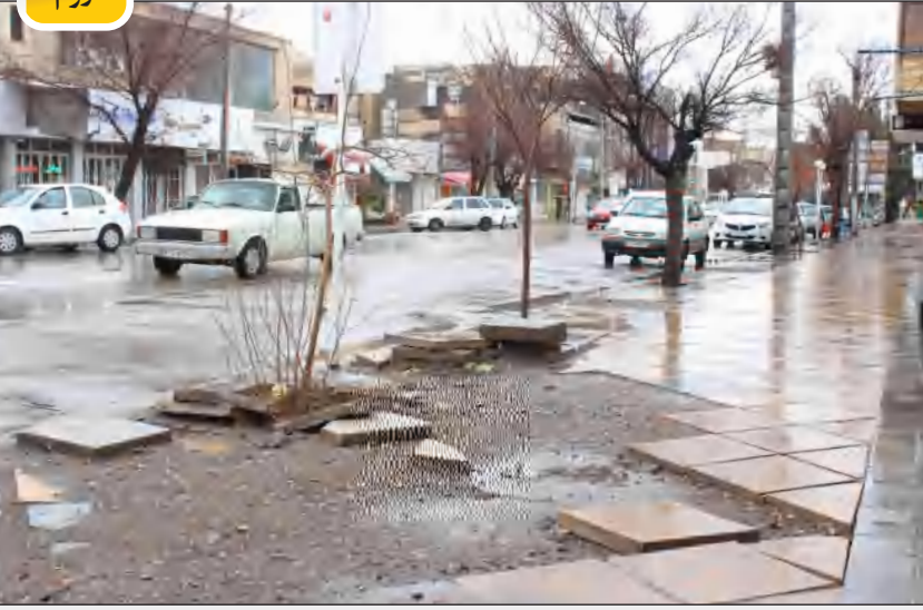
زیبایی شهر ما در روز بارندگی!