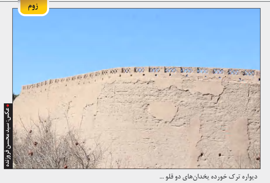
دیواره ترک خورده یخدان های دو قلو ...

زیر چادر مرد رسوا و عیان سخت پیدا چون شتر بر نردبان این در حالی است که اظهارنظرهای رسمی و غیررسمی در کشور ما در مورد بحران اوکراین چنان خام و بی اساس بوده است که گویی هیچ فهم بنیادی در مورد منافع کشوری به نام ایران و چارچوب پیچیده و بغرنجی به نام نظام بین الملل در بین ما ایرانیان شکل نگرفته است. با تأسف بسیار «مزخرف گویی» در مملکت ما در هر سه حوزه رسمی و غیررسمی و ضدرسمی چنان رایج و بی هزینه شده است که گویی انتها ندارد!