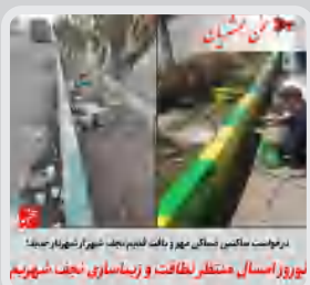
نوروز اسفند منتظر نظافت و زیباسازی نجف شهریم

سخن همشهریان: سلام خدمت شما الان ۵ روزه کوچه ما (خ بدر شمالی کوچه شماره ۲) رو برای فاضلاب کندن و متاسفانه روند مار بسیار کند پیش میره اولاً روز جمعه کار تعطیل بود صبحها دیر شروع می کنن و عصرها زود تعطیل و کمبود نیرو هم کاملاً مشهوده آیا برای یک کوچه چند روز باید بگذره؟؟؟ منظره ای که هر صبح با اون روبه رو هستیم، بالاخره شب عید کارها زیاده و واقعا رفت و آمد برا اهالی کوچه خیلی سخته. و با این شرایط نا امنی شما باید ماشین رو در خیابان پارک کنین. ##انتقاد##حق##مردم##است