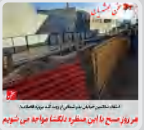
مرکز رسیدگی به این منظره دلگشا مواد بی شوم

سخن همشهریان: سلام خدمت شما الان ۵ روزه کوچه ما (خ بدر شمالی کوچه شماره ۲) رو برای فاضلاب کندن و متاسفانه روند مار بسیار کند پیش میره اولاً روز جمعه کار تعطیل بود صبحها دیر شروع می کنن و عصرها زود تعطیل و کمبود نیرو هم کاملاً مشهوده آیا برای یک کوچه چند روز باید بگذره؟؟؟ منظره ای که هر صبح با اون روبه رو هستیم، بالاخره شب عید کارها زیاده و واقعا رفت و آمد برا اهالی کوچه خیلی سخته. و با این شرایط نا امنی شما باید ماشین رو در خیابان پارک کنین. ##انتقاد##حق##مردم##است