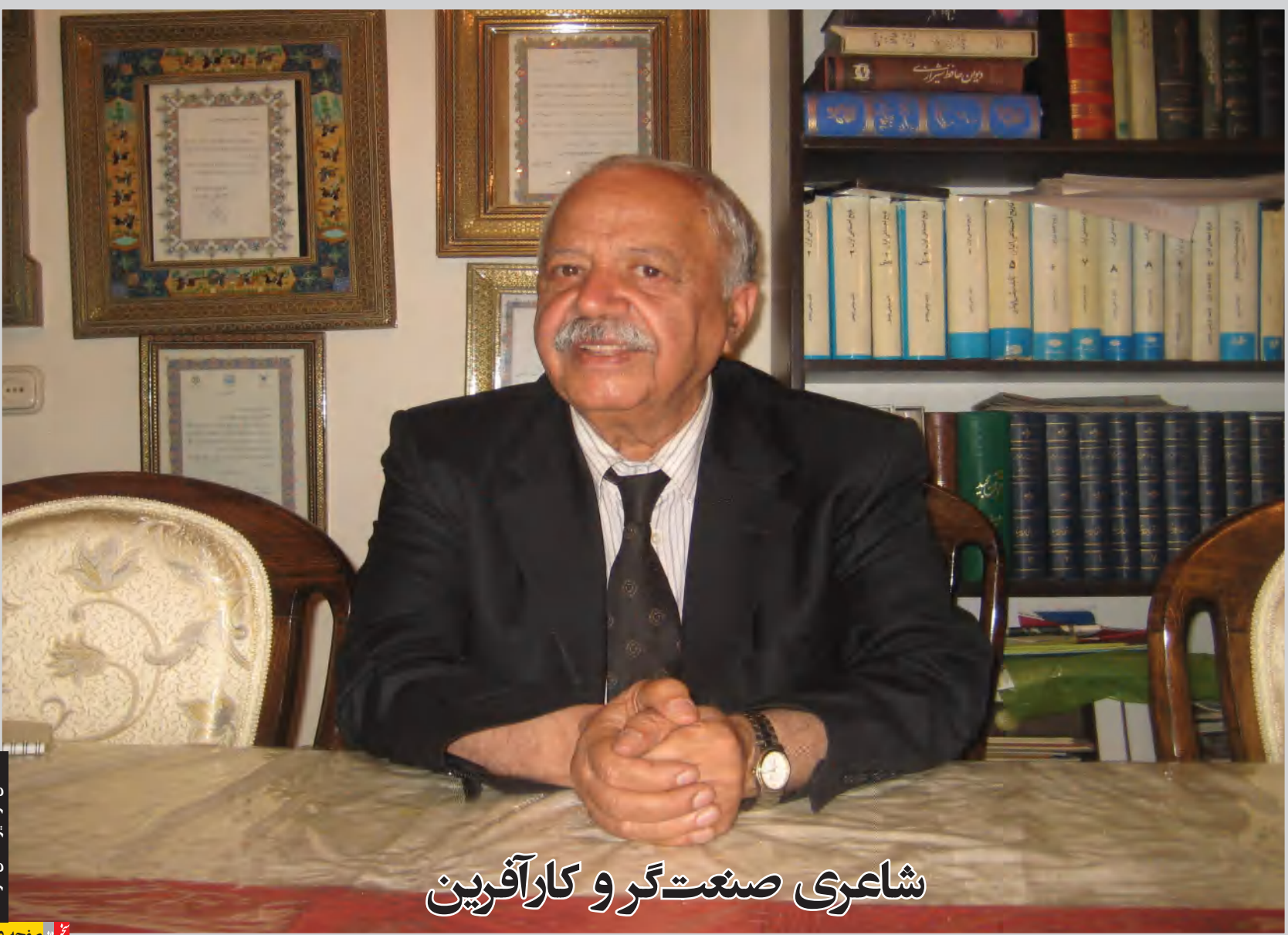
شاعری صنعت‌گر و کارآفرین