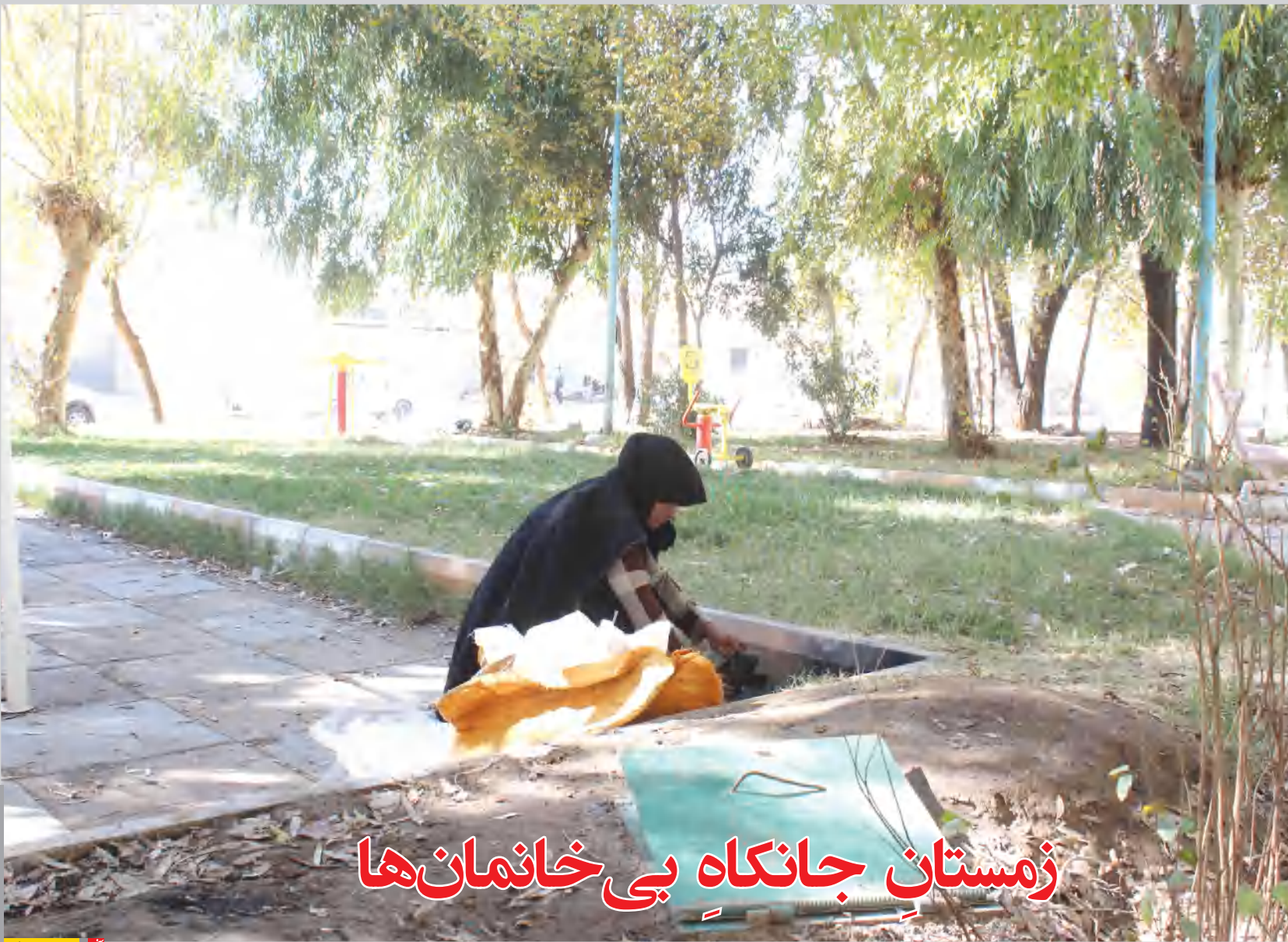
زمستان جانکاه بی‌خانمان‌ها

دشت سیرجان از نظر خطر کاهش شدید در سفره‌های آب شیرین و پیشروی سریع سفره‌های آب شور، عنوان یکی از مناطق فوق بحرانی معرفی شده است. وضعیت پیشروی سفره‌های آب شور و گسترش شوره زارها در دشت سیرجان این منطقه از نظر آب‌های شرب زیرزمینی به عنوان یکی از مناطق بحرانی معرفی شده است.