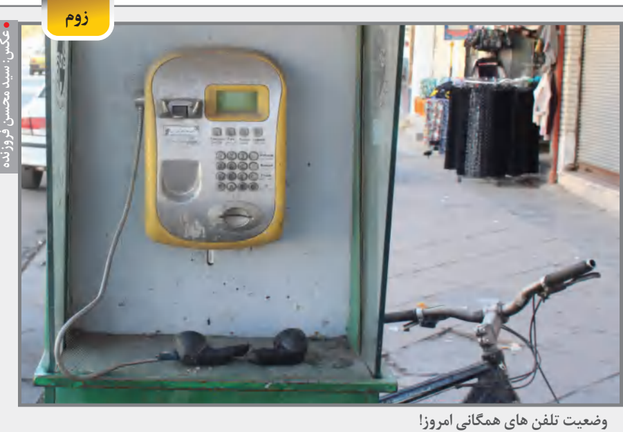
وضعیت تلفن های همگانی امروز!