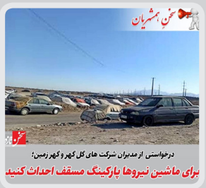
درخواست از مدیران شرکت های کل شهر و شهرستان برای ماشین بارکینگ مستطاف احداث کنند