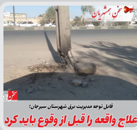
فایل نامه مدیریت برای شهرستان سیرجان علاج واقعه را قبل از وقوع باید کرد

سخن همشهریان: سلام ما را به مدیران شرکت گهر زمین و گل گهر برسوندید و پیگیری کنید که من و امثال من بعضی از مواقع باید با ماشین شخصی از شهر و یا روستا بیایم سر کار اینچنین ماشین های خود را در بیابان و دور از نگرانی های می کنیم که در اثر گرما، سرما و بارندگی منجر به خسارت به خودروهایمان می شود از مدیران محترم درخواست می کنیم که یک محیط و پارکینگ مسقف و دارای نگرانی برای خودرو و نیروها ایجاد نمایند که باعث جلوگیری ضرر و زیان و سرعت از ماشین هایمان شود. کسی تا بحال به این موضوع رسیدگی نکرده و شاید دیده نشده است. #انتقادحق مردم است #پاسخگویی وظیفه مسئولان