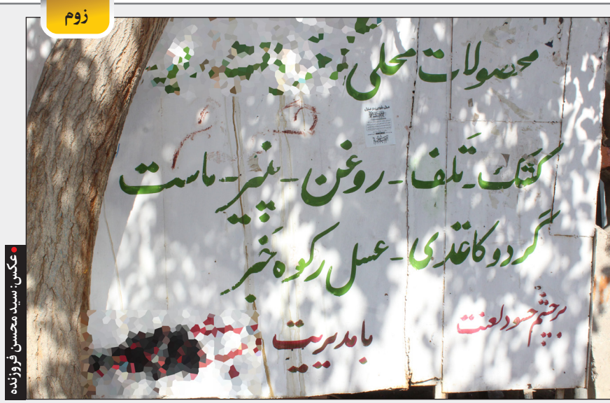
بر چشم حسودا؟

تحریمها به دست و پای اقتصاد کشور پیچیده است و باید این طنابهای کلفت را باز کرد یا حداقل کاری کرد که بشود با ریسمان بسته در دست به زندگی ادامه داد. الان نه می شود زندگی کرد و نه خبری از باز شدن طناب ها هست.